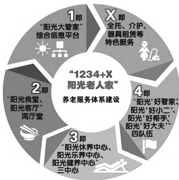
图2 “1234+X 阳光老人家”养老服务体系建设一览